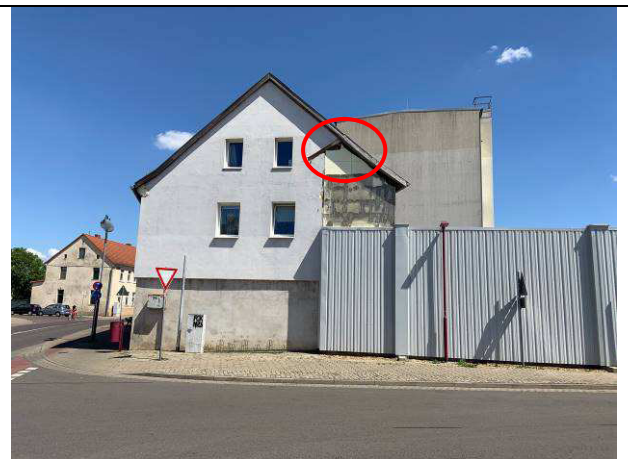
Giebelseite mit möglicher Öffnung für Fledermäuse zum Dachboden