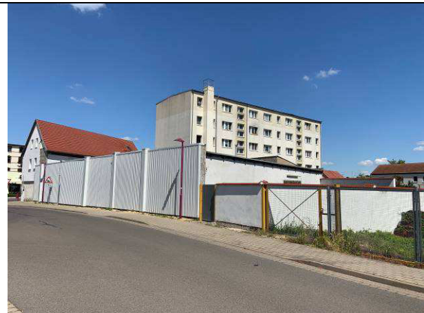
Ansicht nach Nordost; gesamtes Areal des Abrisses