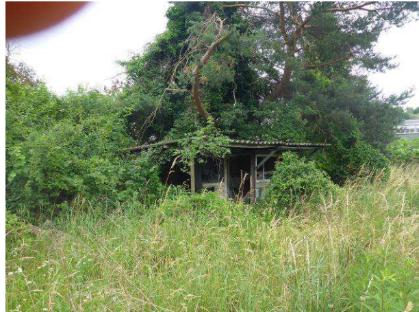
Abbildung 6: alte Gartenlaube, Ostgrenze B-Plangebiet