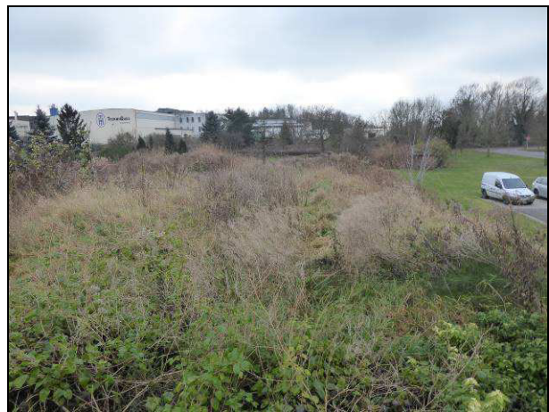
Abbildung 2: Untersuchungsfläche Zauneidechse