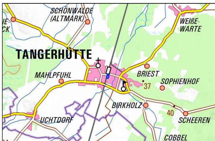
Abbildung 1: Lage des B-Plan-Gebietes im Stadtzentrum von Tangerhütte