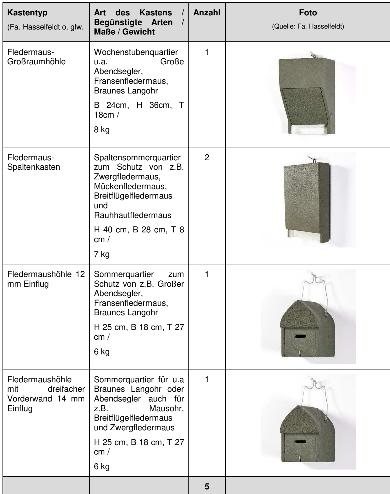
Tabelle 11: FCS-Maßnahme Fledermäuse – Fledermauskästen an Bäumen