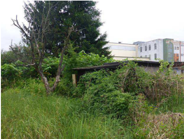
Abbildung 5: alte Gartenlaube, Südostgrenze B-Plangebiet