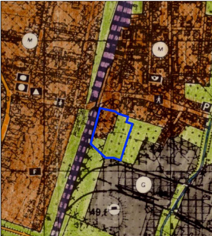
Abb. 1: Ausschnitt aus dem wirksamen Flächennutzungsplan, ohne Maßstab

Der Flächennutzungsplan der Stadt Tangerhütte ist mit Wirkung vom 10.02.1993 in Kraft getreten. Im Flächennutzungsplan der Tangerhütte ist das Plangebiet, in dem das Vorhaben entwickelt werden soll, als Mischbaufläche dargestellt. Der Bebauungsplan weicht von den im Flächennutzungsplan dargestellten Bauflächen ab und wird im Parallelverfahren geändert.